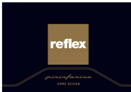
Copertina catalogo Pininfarina – Reflex

In occasione del 30° anniversario e della MDW2019, verrà presentato il BOOK dedicato alla collezione Pininfarina ; un libro/catalogo che racconta tutti i prodotti che il famoso brand ha disegnato per la Reflex.