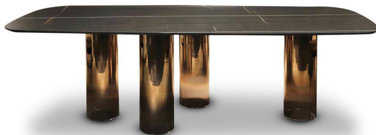
Signore degli Anelli 72

La ricerca e innovazione sarà espressa al meglio nell'utilizzo della nuova finitura "sputtering" in diverse declinazioni cromatiche, che conferirà un carattere stilistico unico ai prodotti ( Accademia collezione, Lux collezione, Ark 72, Signore degli Anelli, Dandolo lamp ).